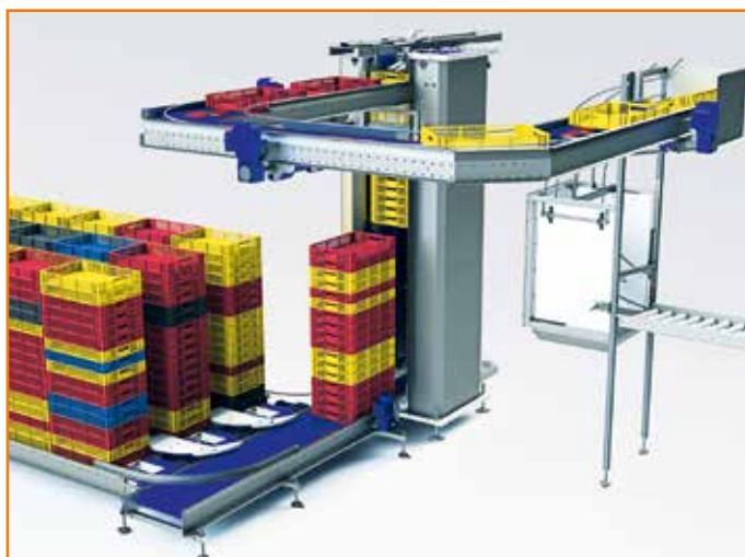
Entstapelung vor der Waschmaschine