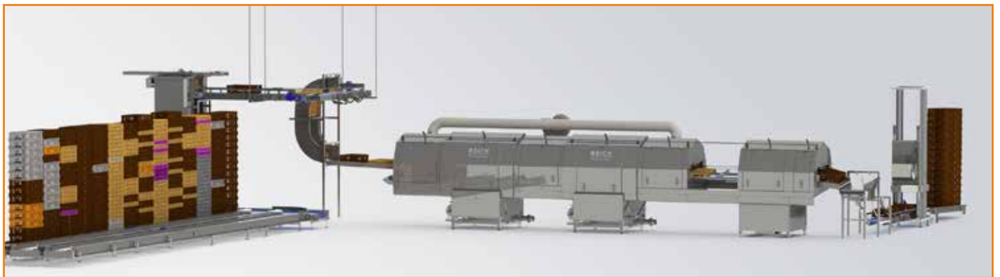
Automatisierung vor- und nach der Waschmaschine