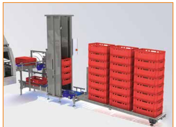
Bestapelung nach der Waschmaschine