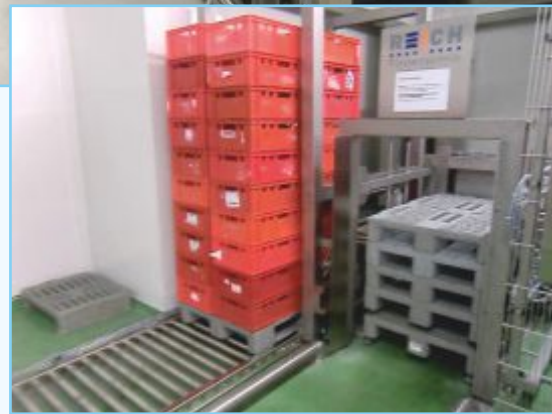
Die Vollautomatische Palettierung mit Palettenmagazin von Reich ist mit ihrem geringen Platzbedarf die ideale Ergänzung für die innerbetriebliche Palettenlogistik.